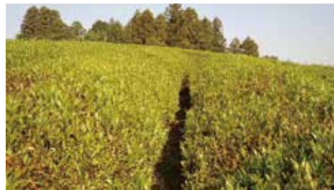
4 霜害のため、収穫できなくなった茶園。 2019年5月13日撮影／自宅前茶園