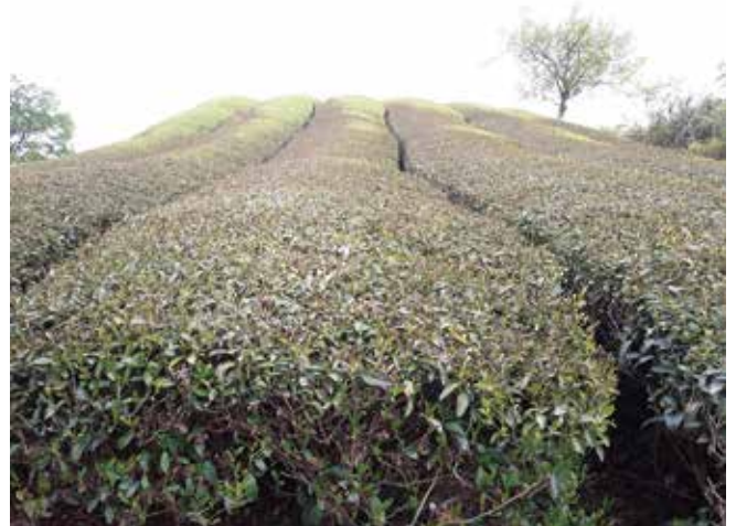
1 防霜扇が無く、霜が降りやすい立地の茶園での霜害状況。 2019年5月9日撮影／コクダシ3茶園