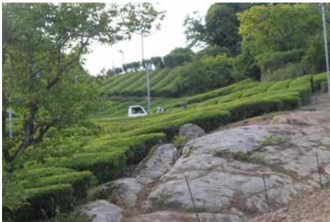
・約1億年前、本州が形成されるに関わった、花崗岩を多く含む領家帯という地質で育つ茶園。

当 園では1984年から有機栽培によるお茶づくりをしてきました。そして2011年には新たに自然栽培にも取り組み始めました。この11年間、自然栽培に取り組んだことで、今後、当園が作っていききたいと考えるお茶づくりの方向性がはっきりしてきました。今年は、そのように至るまでの経緯を、総まとめしながら新茶案内とさせていただきます。