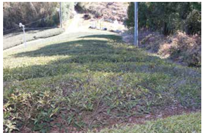
・自然栽培に取り組み始めて数年が経過した頃、日陰になるエリアだけ、枝から葉が落ちてしまい茶樹の生育が困難になった茶園。

以上のように、この11年間、茶園を観察する中で、何らかの原因で茶樹の生育が阻害されていると判断した部分があれば、手を入れて修整し、さらに経過観察を繰り返すことで、茶樹が自らの力で育つ茶園環境が出来てきました。そのなかで、私たちが「ちょっとしたこと」と思いがちなことに対しても、一株一株の茶樹は、その地点に敏感かつ素直に反応しながら育っているのだと気づきました。